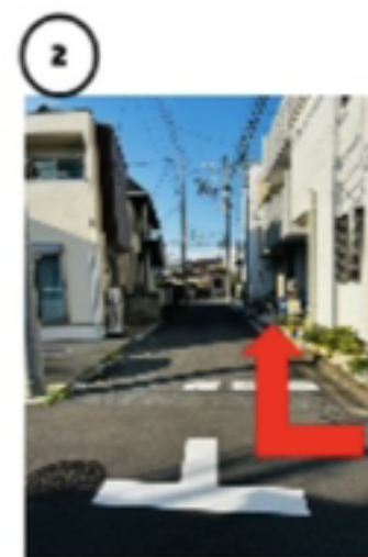
2つ目の右への曲がり角