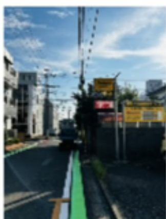
ねこカフェ側から見た 駐車場看板

※ねこカフェスタッフ用の駐車場には 停めないでください。 ※空いていない場合はお近くの パーキングをご利用ください。 申し訳ございませんが、パーキング代は お客様負担となります。