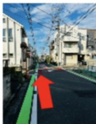
駐車場を左手にして 進行方向を見た時