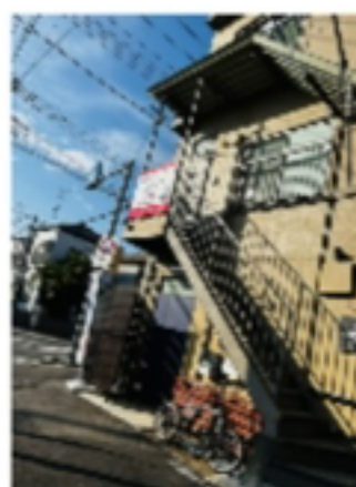
右手に見えてきます