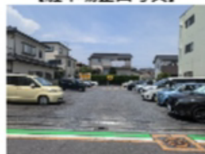
奥のパーキング名称 ⇒タイムズ大宮堀の内町第5