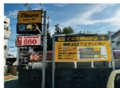
道路から見える看板