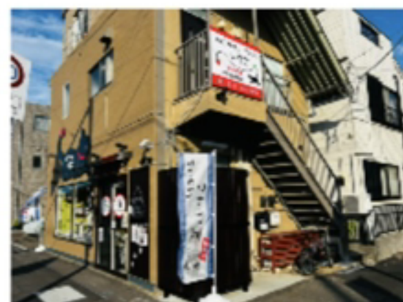
到着です！！ 1F表のガラス戸からお入りください