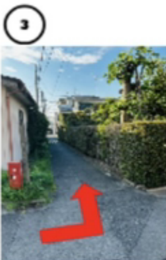
3つ目の左への曲がり角