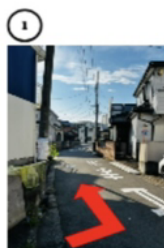
1つ目の左への曲がり角